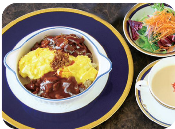
牛フィレ肉のストロガノフ風 オムライスランチ サラダ スープ 付 ¥1,850