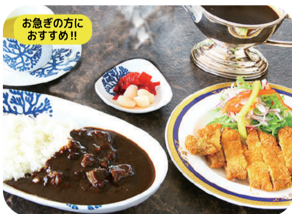
県産ブランド「肥後あそび豚」の ブラックカツカレーセット (ライス200g) サラダ スープ 漬物 付 ¥1,800