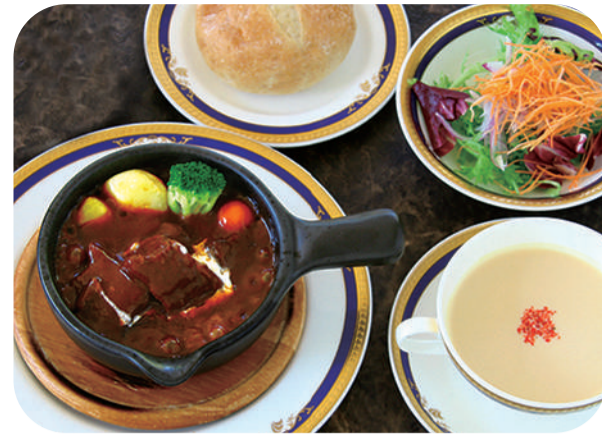
くまもとあか牛バラ肉の ビーフシチューランチ サラダ スープ ライスorパン 付 ¥1,900