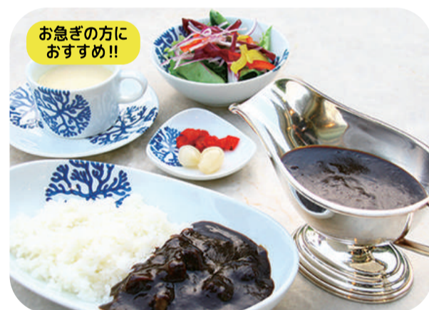
KKRホテルオリジナル ブラックビーフカレーセット (ライス200g) サラダ スープ 漬物 付 ¥1,300