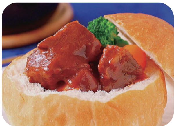
KKRホテルの ビーフシチューポット (BSP) ¥1,300