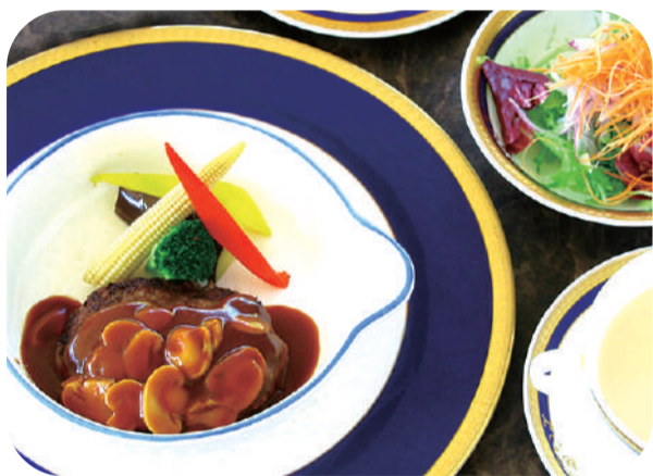
阿蘇高原赤牛の ハンバーグステーキランチ サラダ スープ ライスorパン 付 ¥1,850