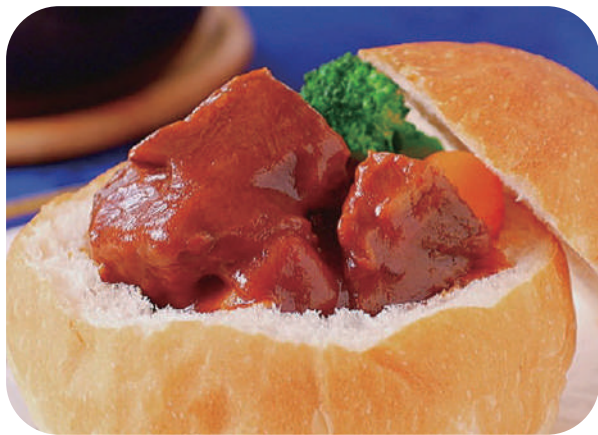
KKRホテルの ビーフシチューポット (BSP) ¥1,200