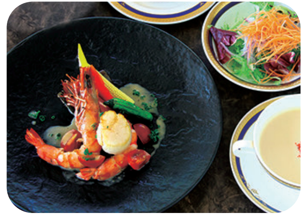
有頭海老と北海道帆立の ポワレランチ サラダ スープ ライスorパン 付 ¥1,700