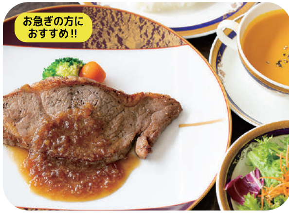
牛サーロインステーキランチ (和風オニオンソース) サラダ スープ ライスorパン 付 ¥1,850