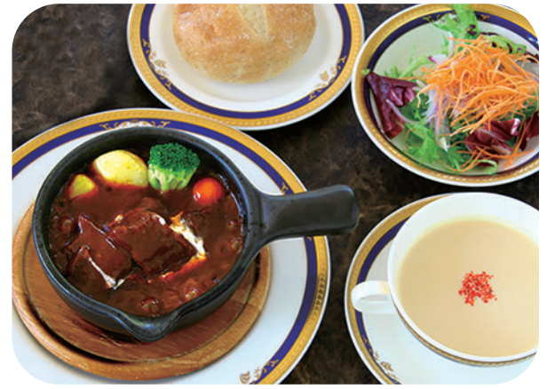
8時間煮込んだ国産牛ホホ肉の ビーフシチューランチ サラダ スープ ライスorパン 付 ¥1,750