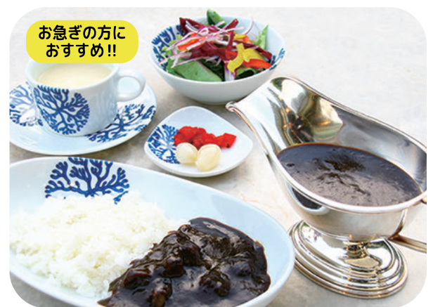
KKRホテルオリジナル ブラックビーフカレーセット サラダ スープ 漬物 付 ¥1,200