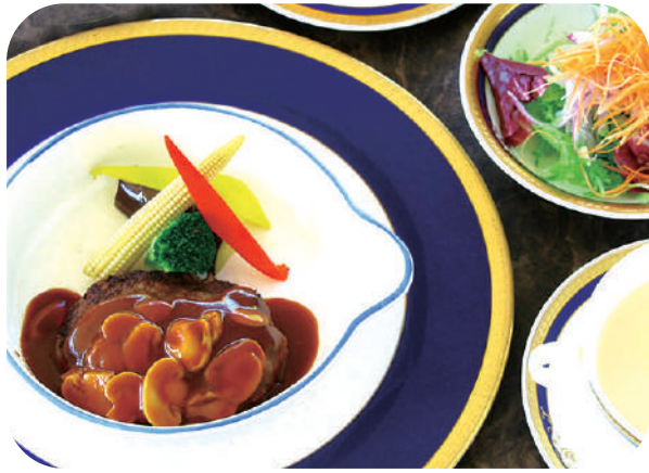
阿蘇高原赤牛の ハンバーグステーキランチ サラダ スープ ライスorパン 付 ¥1,750