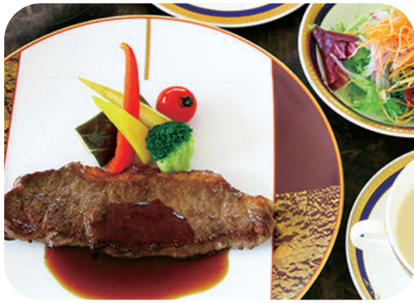
黒毛和牛熟成肉の サーロインステーキランチ サラダ スープ ライスorパン 付 ¥4,300