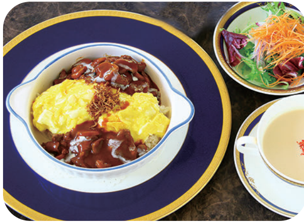
牛フィレ肉のストロガノフ風 オムライスランチ サラダ スープ 付 ¥1,750